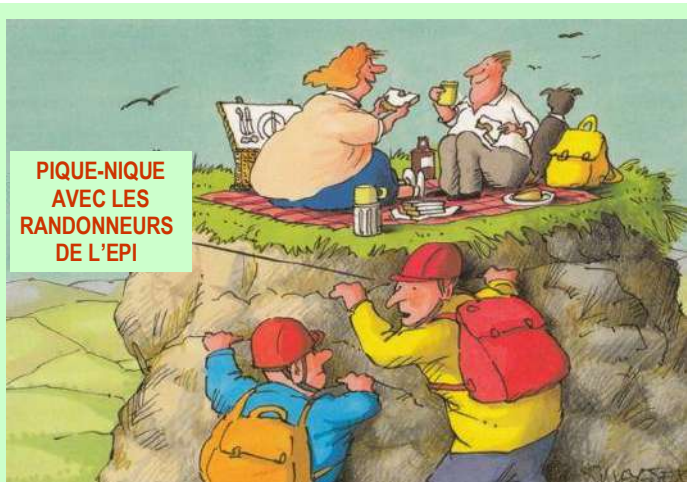
PIQUE-NIQUE AVEC LES RANDONNEURS DE L'ÉPI

A ce jour, l'association ne propose donc pas de créneaux hebdomadaires à la salle du petit foyer mais nous nous retrouverons à partir de la rentrée 2021.