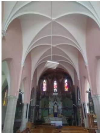
L'église repeinte en mai 2021

Baudreix signifierait « Beau vallon ». Au cours des siècles, le village a traversé plusieurs tragédies. Voici celles qui ont marqué l'histoire de notre village.