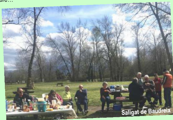
Saligat de Baudreix