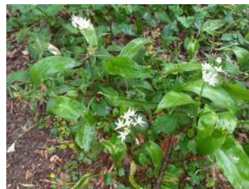
L'ail des ours