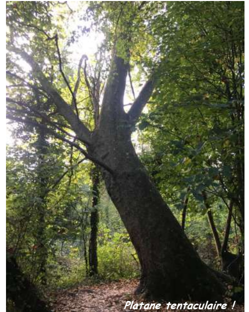
Platanus tentaculata !

Grâce à l'application BirdNet téléchargeable sur votre mobile, vous pourrez découvrir grâce à leurs chants, la diversité des oiseaux que la saligue abrite : Grimpereau des jardins,