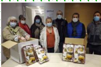
En fin d'année 2020, le CCAS de Baudreix a organisé la distribution de paniers gourmands aux aînés de notre village. Ils ont reçu un accueil chaleureux.

► Des articles sont parus dans La République des Pyrénées et des interventions sur France Bleu Béarn sont envisagées.