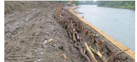
Peigne en bois et fascines

- installer, entre les épis, un peigne en bois de 180 m de long. Le peigne est constitué de 3 rangées de pieux de châtaigner, de 3 et 4 m de longueur, plantés verticalement et comblés par des branchages (fascines). Une fois le peigne installé, le talus a été protégé par un géotextile en coco et végétalisé ;