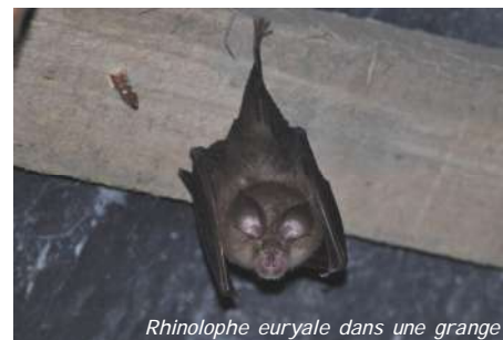
Rhinolophe euryale dans une grange

Le cycle de vie annuel des chauve-souris est simple. Actuellement, elles sont en recherche intensive de nourriture pour faire des réserves afin de se préparer à