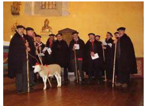
Le Noël des Bergers à Arcizan-Dessus

Au XIX e siècle, la bûche apparaît comme le gâteau de Noël, création d'un pâtissier de Paris, Lyon ou Monaco (les avis divergent). Il ne se démocratisera qu'après la guerre de 1940-45.