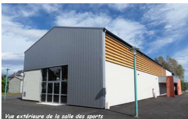
Vue extérieure de la salle des sports

L'association Sautaprats qui avait été pressentie par la municipalité pour l'utilisation de cette nouvelle salle des sports n'a finalement pas intégré les lieux.