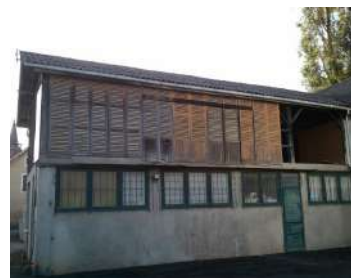
Premier atelier de menuiserie Milhé

entre 1975 et 1980 grâce une très grosse commande : les bureaux de l'usine Turboméca de Bordes !