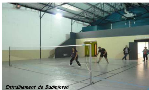
Entraînement de Badminton