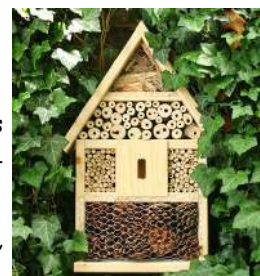
hôtel à insectes