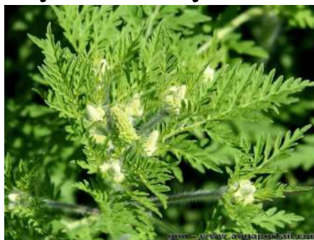
Une ambrosie en fleurs

ton (cyprès, frêne, platane, chêne...), présents principalement dans le Sud de la France. Le cyprès et le bouleau, arbres d'ornements étaient très prisés pour embellir les parcs, les jardins et les villes mais se sont révélés fortement allergisants.